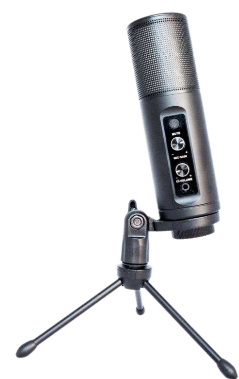
Конденсаторные микрофоны от 21 400 р.