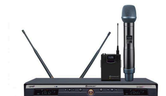
Ручные радиосистемы от 7 600 р.