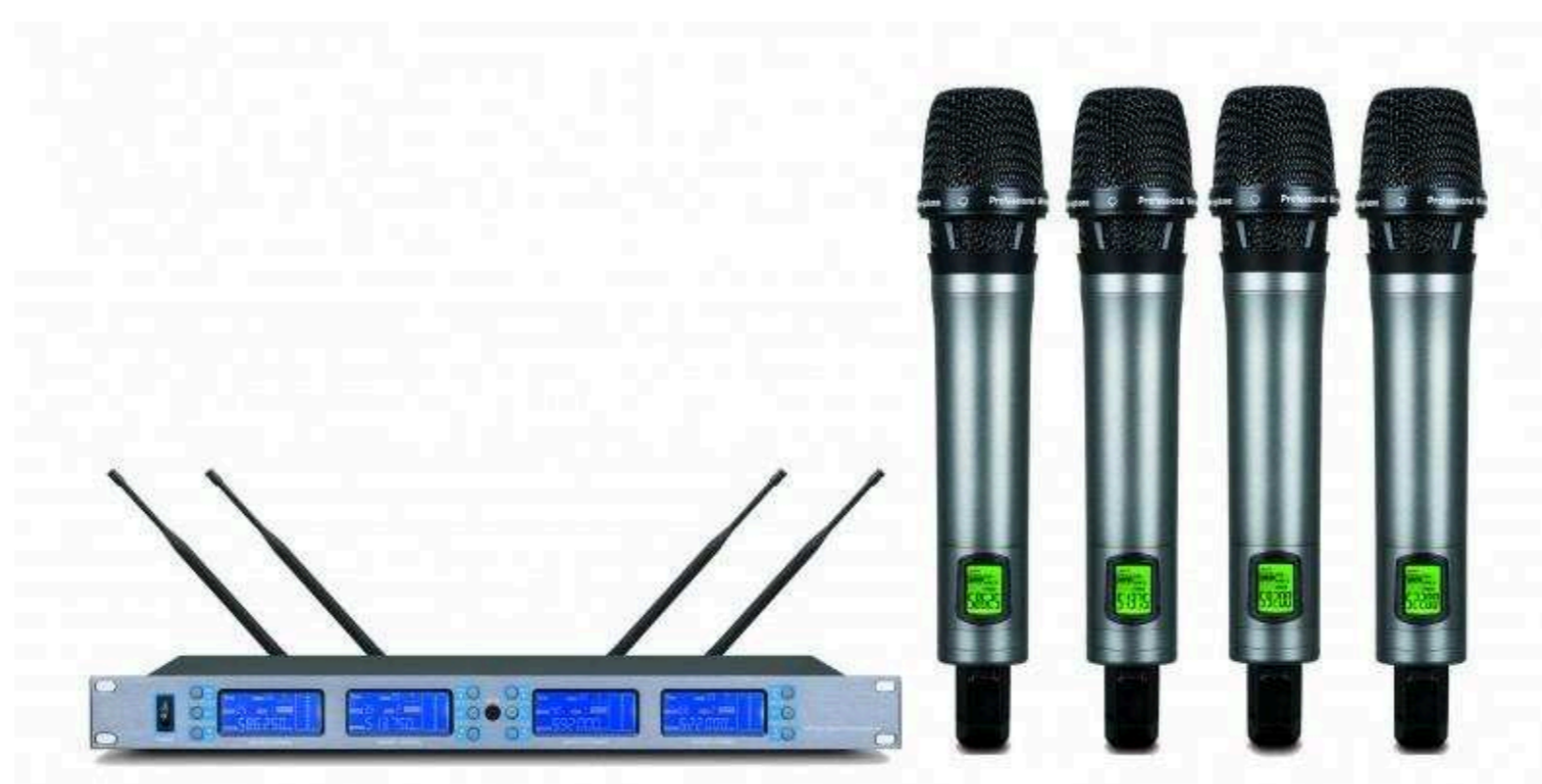
Четырехканальные радиосистемы от 87 400 р.