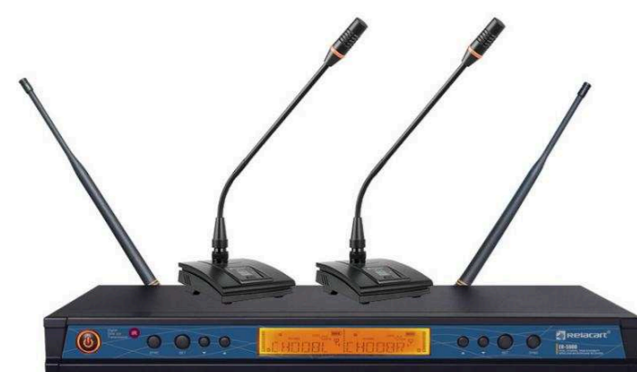
Двухканальные радиосистемы от 44 800 р.