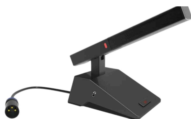
Настольные микрофоны от 13 700 р.