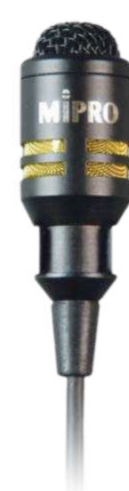
Петличные микрофоны от 11 700 р.