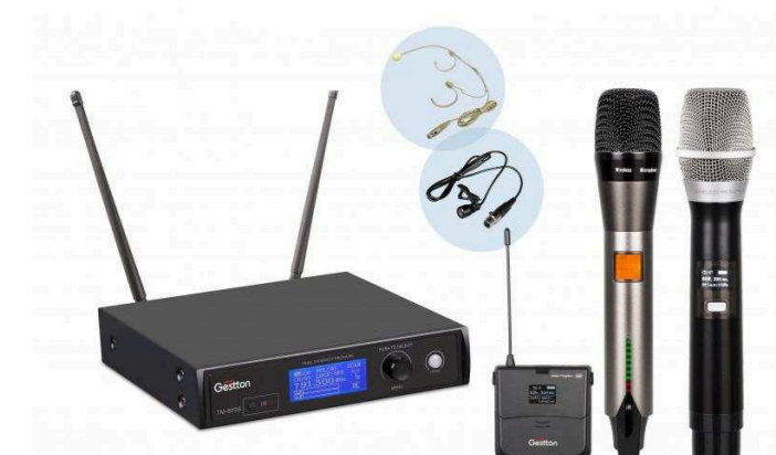
Одноканальные радиосистемы от 25 500 р.