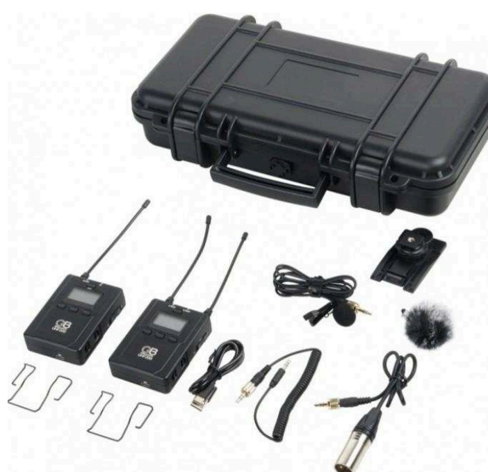
Петличные радиосистемы Цена по запросу