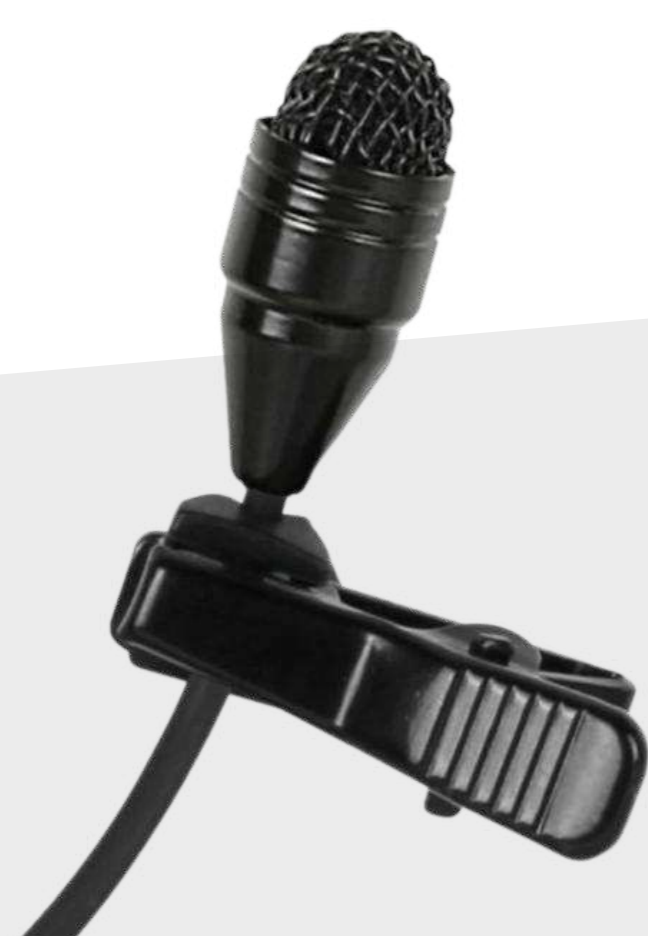
Студийные микрофоны от 18 000 р.

Подберем оборудование точно под задачу по этим характеристикам: