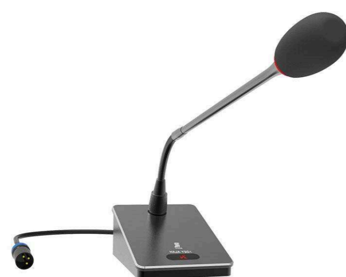
Микрофоны на «гусиной шее» от 13 700 р.