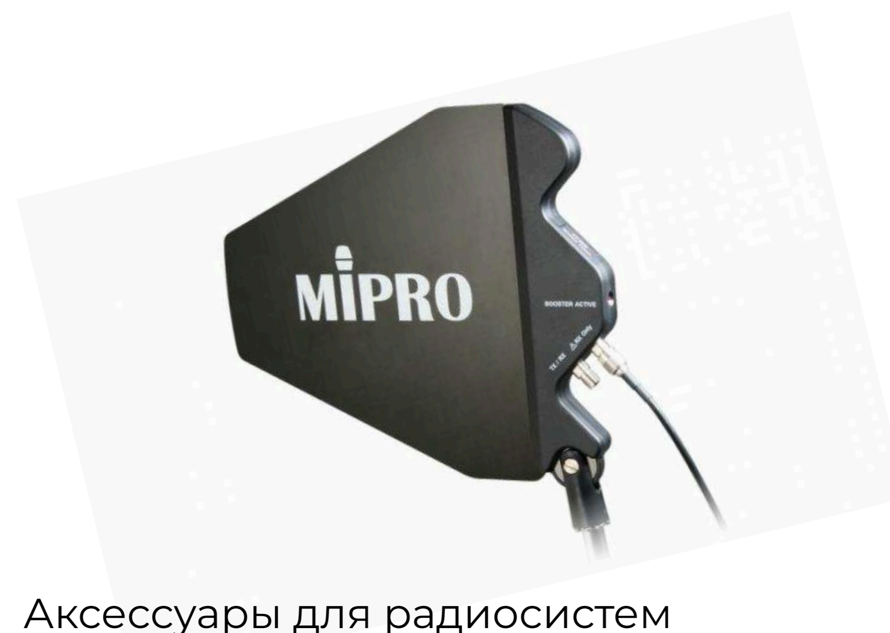
Аксессуары для радиосистем от 3 300 р.

Подберем оборудование точно под задачу по этим характеристикам: